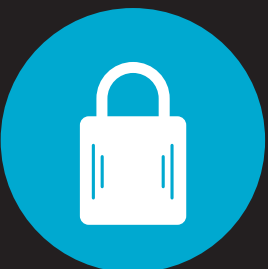
Hængelås (skur, kælder)